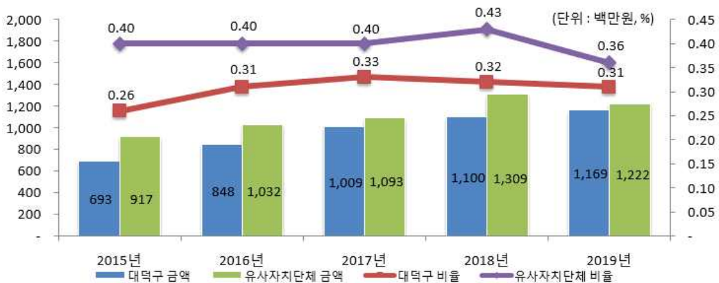
행사·축제경비 비율 유사 지방자치단체와 비교