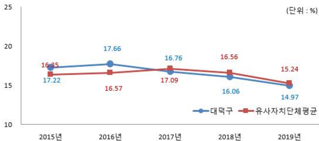
유사 지방자치단체와 재정자립도(당초예산) 비교

☐ 재정자립도는 2016년도부터 조금씩 하락하는 추세이며, 2019년은 이전재원 증가액 263억 대비 자체세입 증가액이 3억밖에 되지 않아 세입과목 개편후 재정자립도는 전년도 대비 1.09% 하락한 14.97%임.