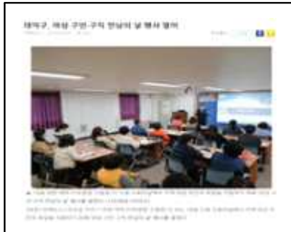
구인-구직 만남의 날