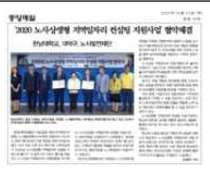
노사상생 지역일자리아업 협약