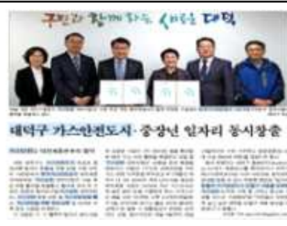
시-구 협력적 일자리아업