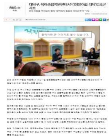
<토크 콘서트 개최>