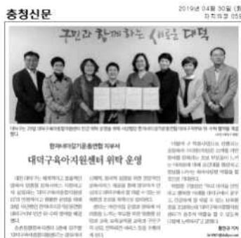
<육아지원센터 위탁체 선정>