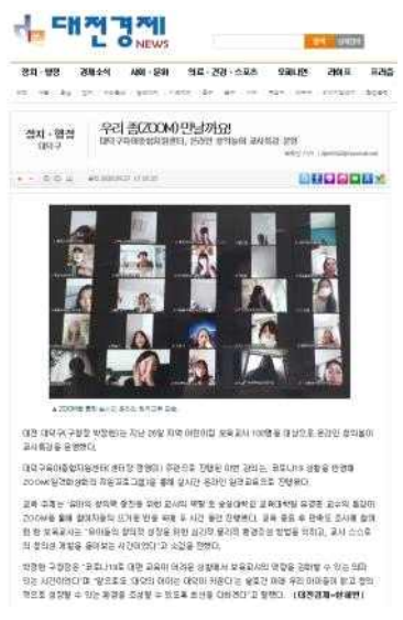
<창의놀이 교사 특강운영>