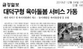
<대덕구형 육아돌봄 서비스제공>