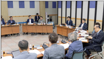
활동사진(2024. 4분기 정기회의)