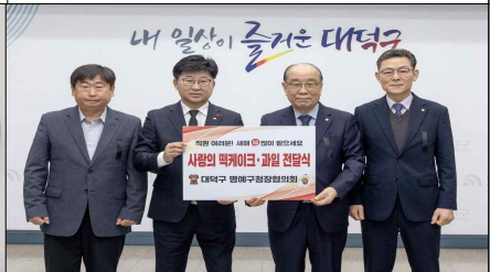
직원 격려 사랑의 떡케이크·과일 전달식