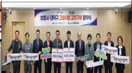
활동사진(대덕구·보령시 교차기부 협약식)