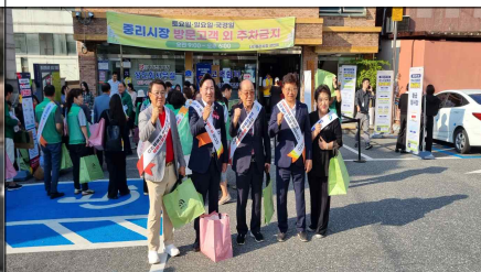
활동사진(2025 추석맞이 장보기 행사)