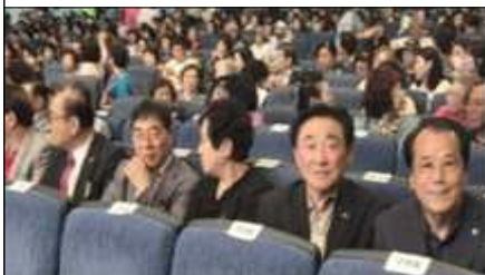
활동사진(2025 대덕구민의 날 행사)