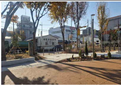
노촌어린이공원 재조성사업 조성사진