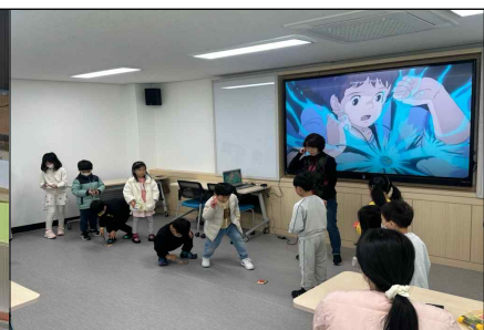
어린이 맞춤 프로그램