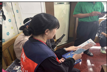
교육자료 안내 및 상담