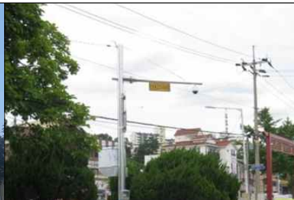
<방범용 CCTV 성능개선>