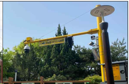
<스마트AI CCTV 설치>