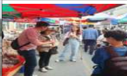
대전 KBS 방송촬영