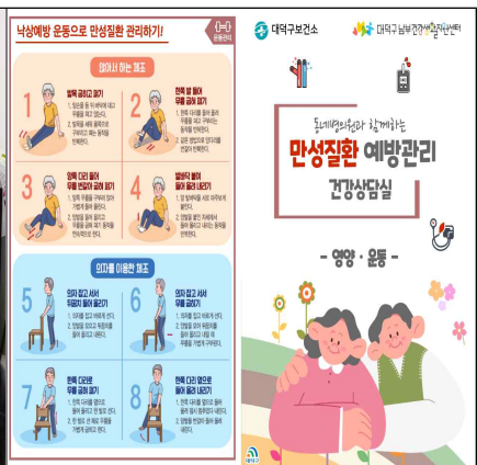
운동·영양관리 교육자료 제작 및 배포