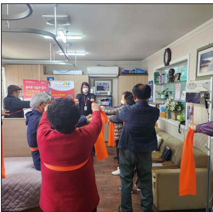
만성질환관리를 위한 밴드 이용 소근육 강화 운동