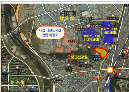
오정동 근린공원 내 대표도서관 건립제안 및 협의