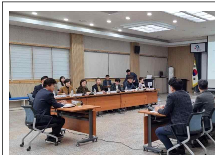
대덕구 공공도서관 중장기 발전계획 최종보고회 개최