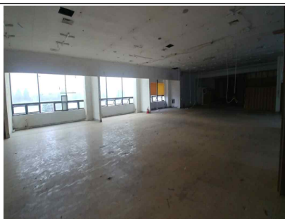
지체장애인협회 사무실 공사현장