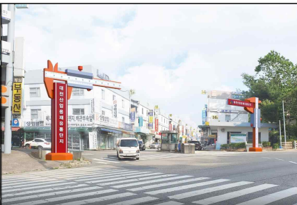
대전산업용재유통단지 조형물 설치