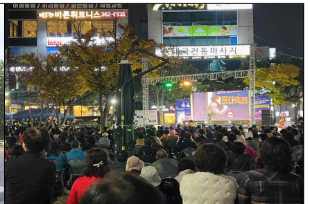
전통시장 및 상점가 소비촉진 이벤트