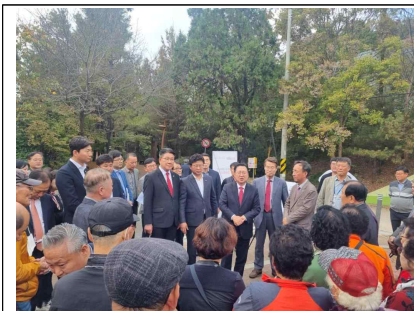
대전시장 「자치구 방문」(현장방문)