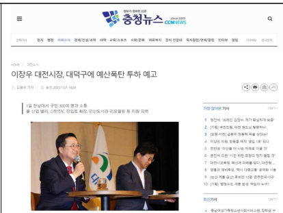
대덕구 예산 지원