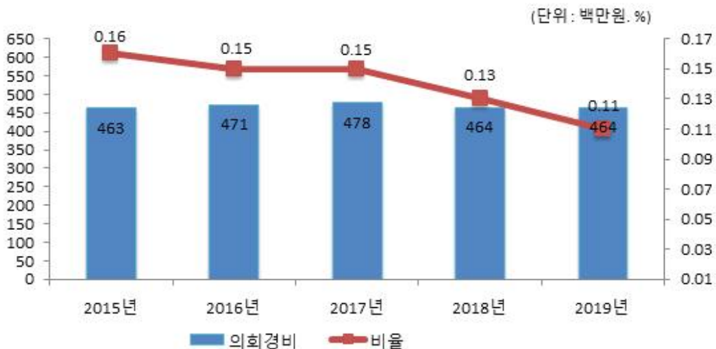
의회경비 연도별 집행액 및 비율 변화