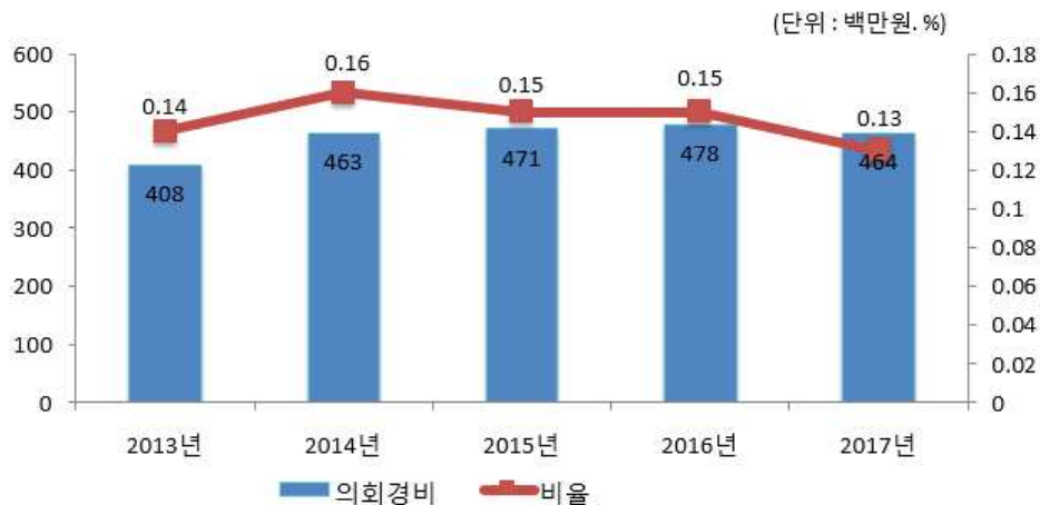
의회경비 연도별 집행액 및 비율 변화