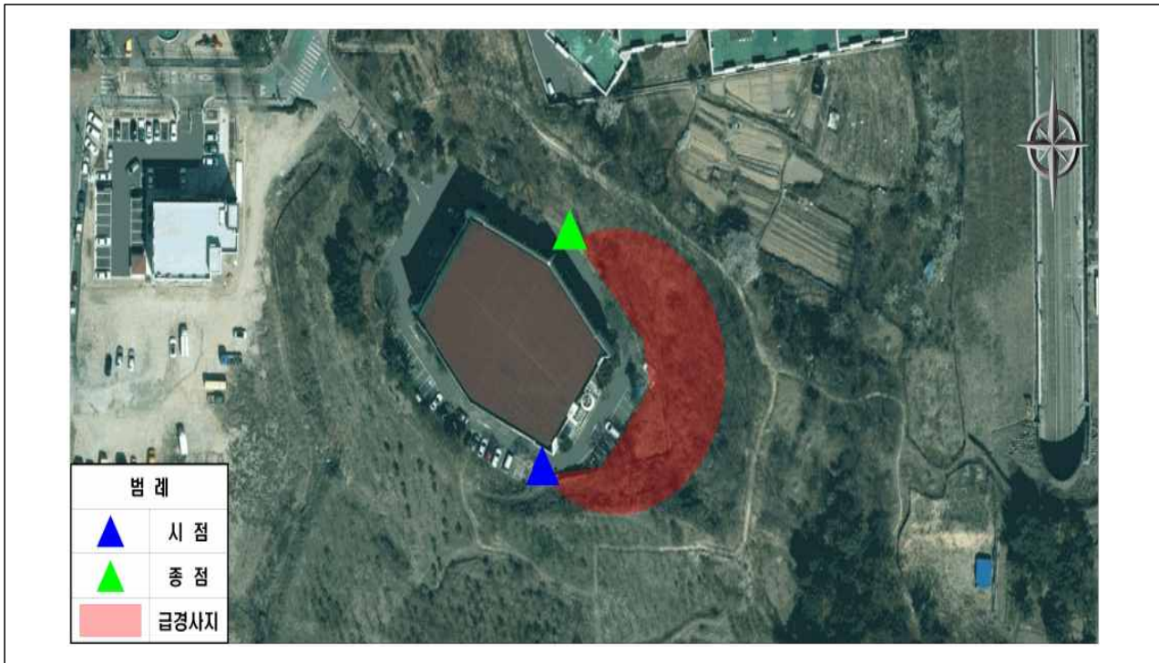
대덕구 목상동 산6-2 (지형도면)