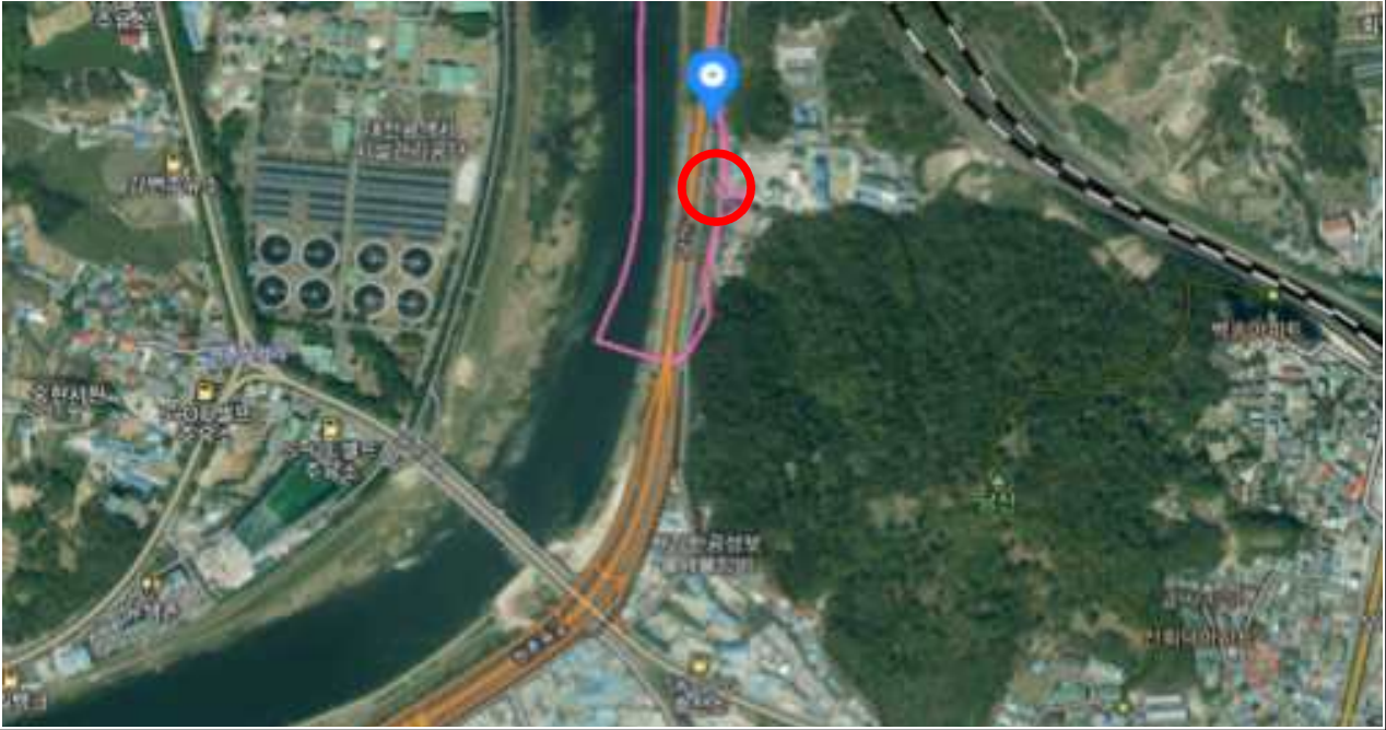
위 치 도