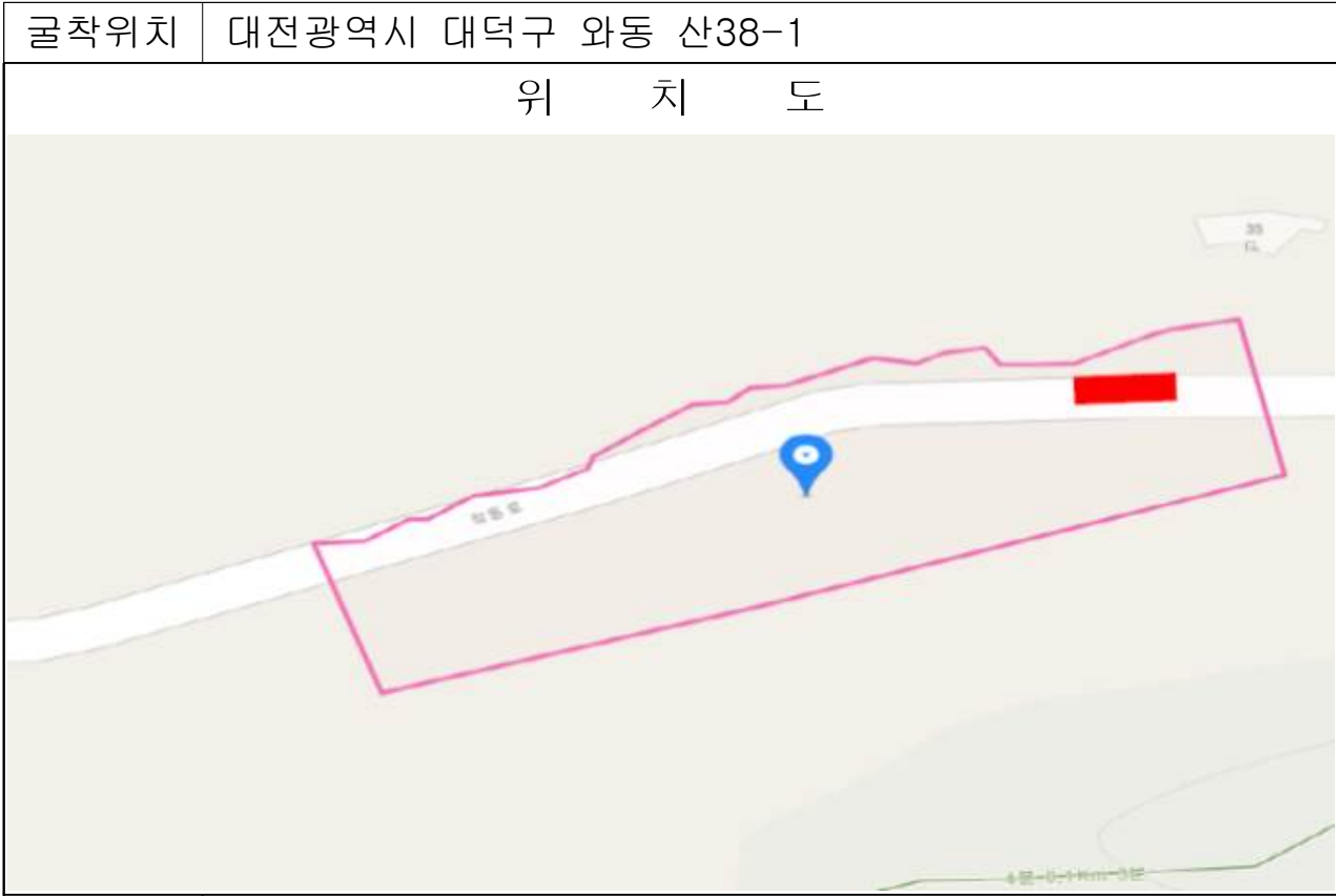
굴착위치 대전광역시 대덕구 와동 산38-1 사 진