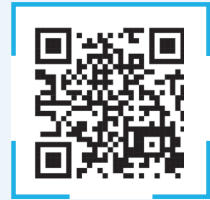
장애인 개인예산제 시범사업 참여자 모집