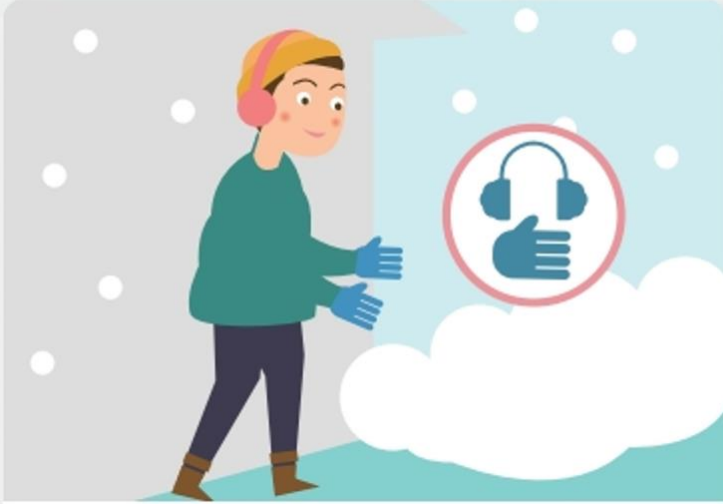
외출 시에는 동상에 걸리지 않도록 보온에 유의합니다.