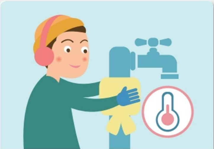
수도계량기, 보일러 배관 등은 헌 옷 등으로 보온합니다.