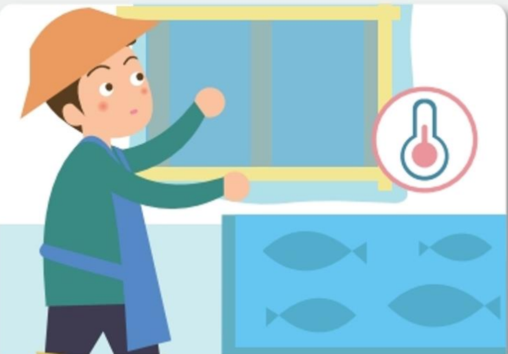
양식장에 월동장을 설치하고, 방풍망을 준비합니다.