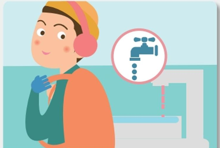
장기간 외출 시 온수를 약하게 틀어 동파를 방지합니다.