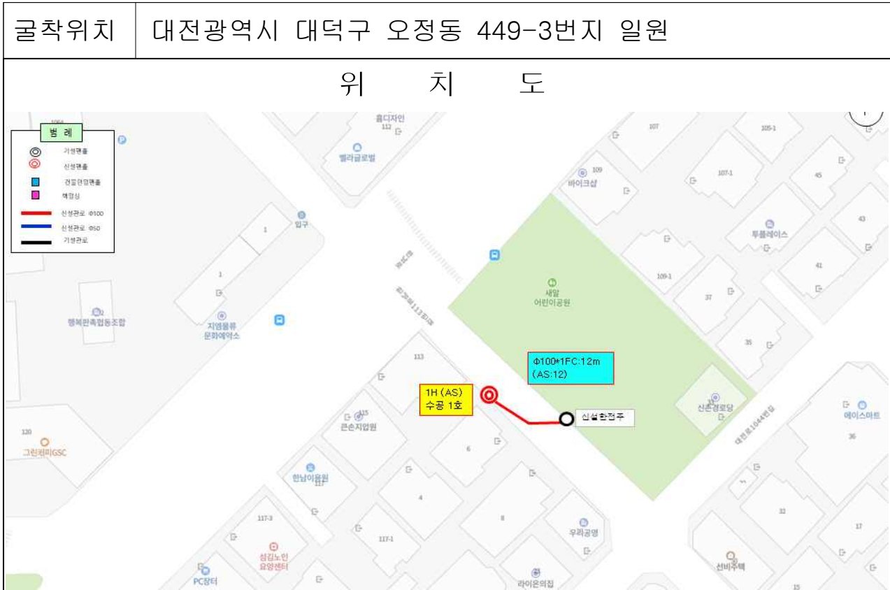
굴착위치 대전광역시 대덕구 오정동 449-3번지 일원