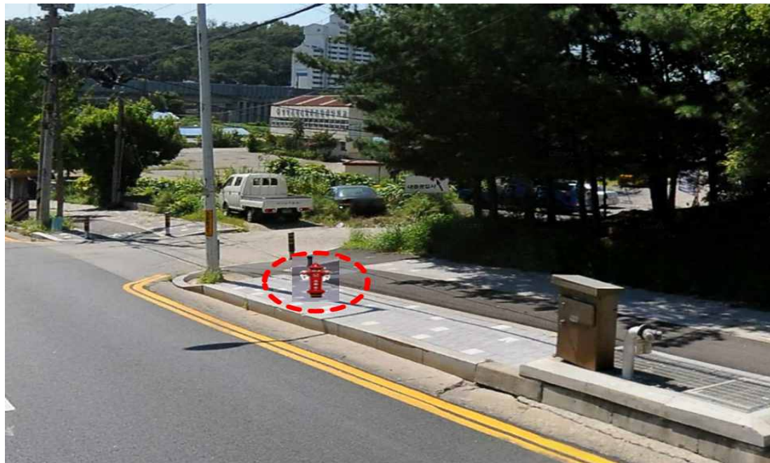
현 황 사진